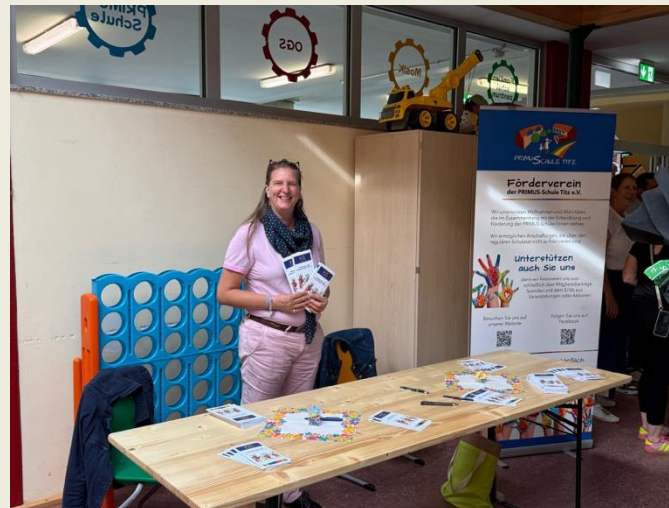
Infostand Einschulungsfeier Mitgliederversammlung 2026