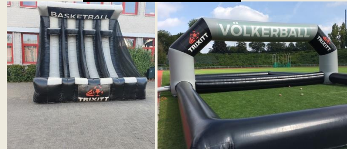
TRIKIT Sportfest / Sponsored Walk